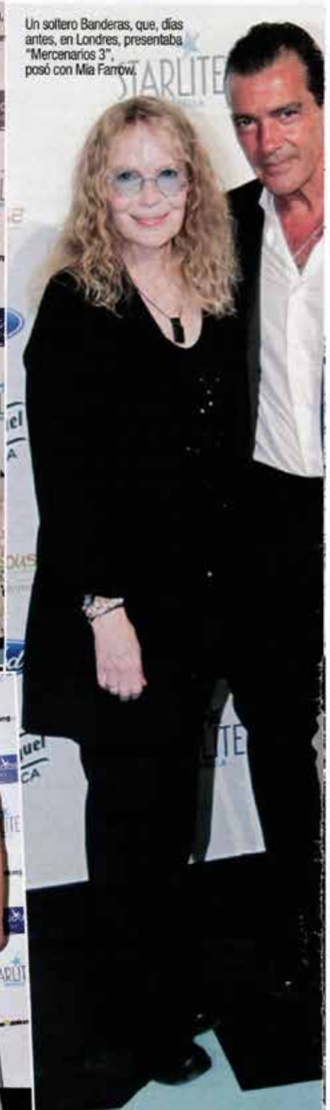
Un soltero Banderas, que, días antes, en Londres, presentaba "Mercenarios 3", posó con Mia Farrow.