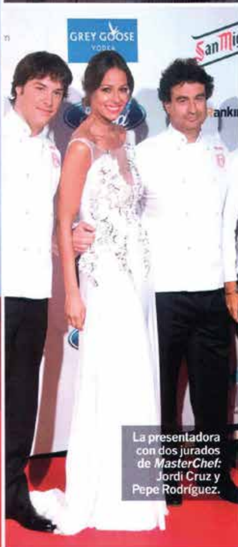
La presentadora con dos jurados de MasterChef : Jordi Cruz y Pepe Rodríguez.