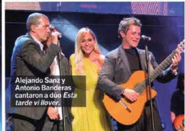
Alejandro Sanz y Antonio Banderas cantaron a dúo Esta tarde vi llover .