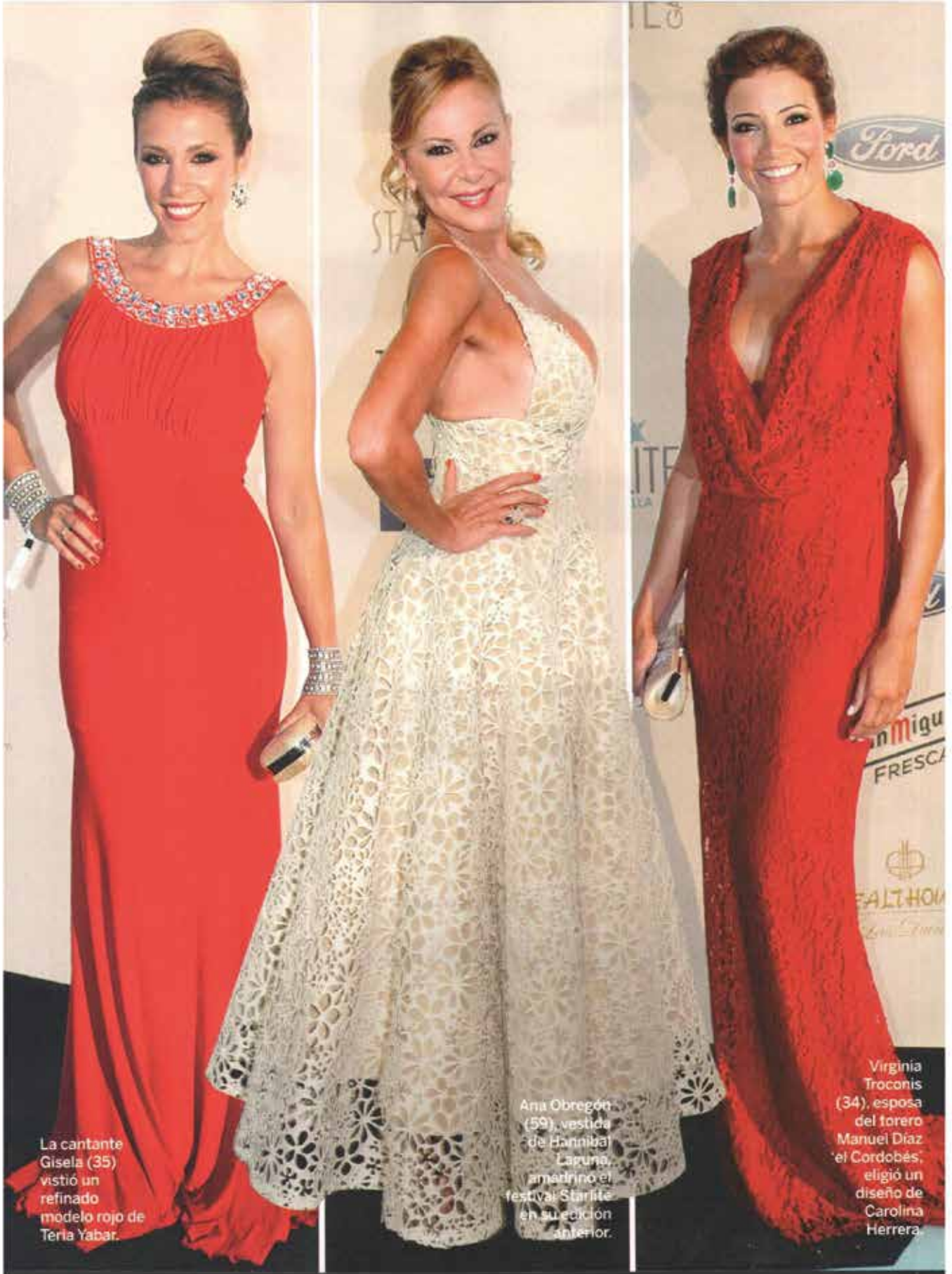
La cantante Gisela (35) vistió un refinado modelo rojo de Teria Yabar.