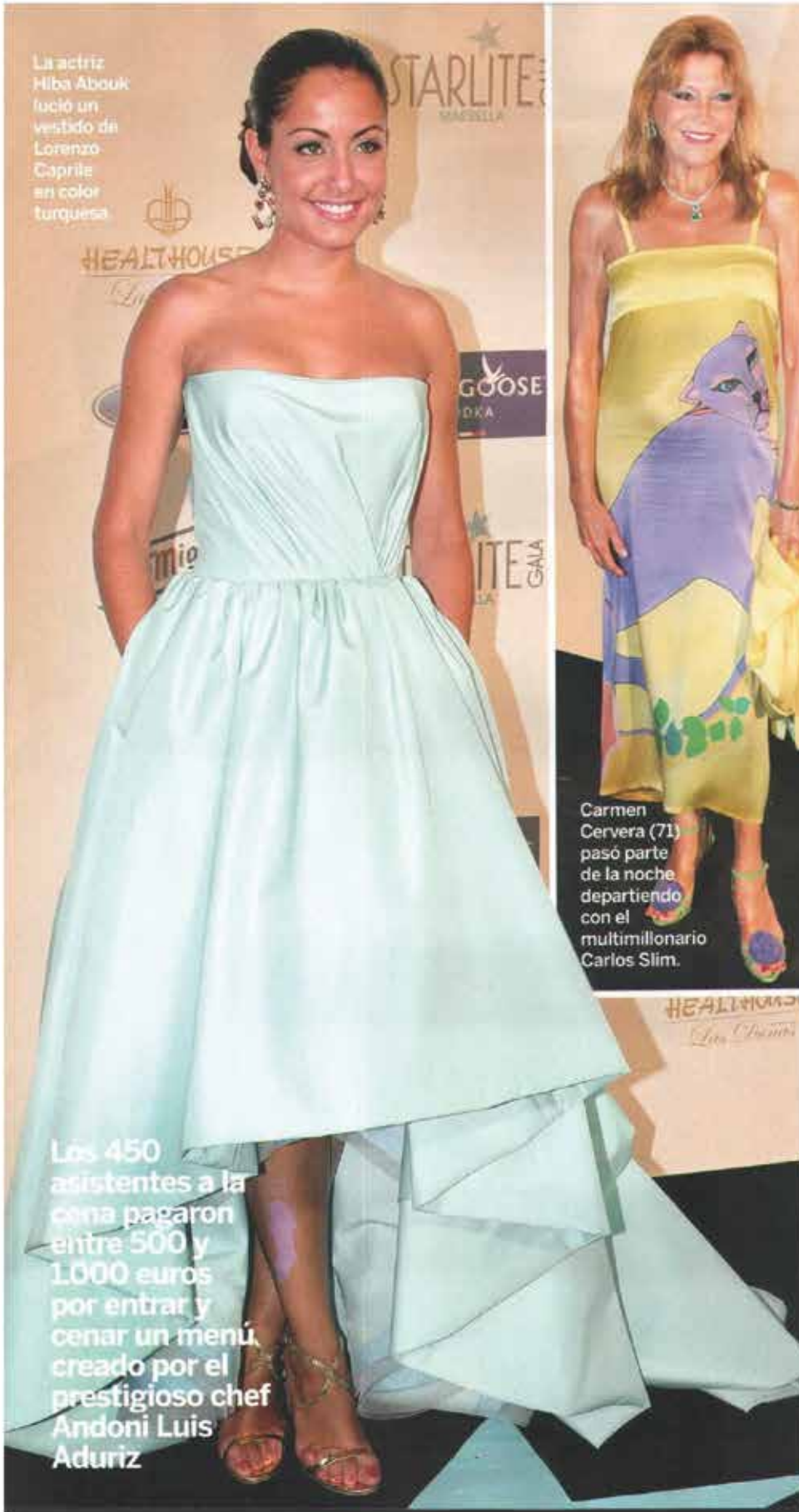
La actriz Hiba Abouk lució un vestido de Lorenzo Caprile en color turquesa

Los 450 asistentes a la cena pagaron entre 500 y 1.000 euros por entrar y cenar un menú creado por el prestigioso chef Andoni Luis Aduriz