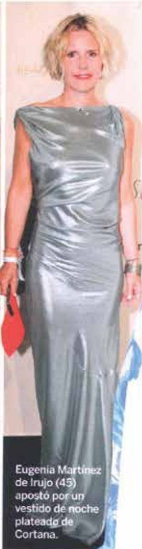
Eugenia Martínez de Irujo (45) apostó por un vestido de noche plateado de Cortana.