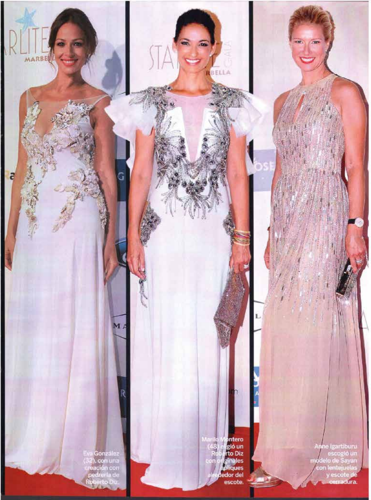
Eva González (32), con una creación con pedrería de Roberto Diz.