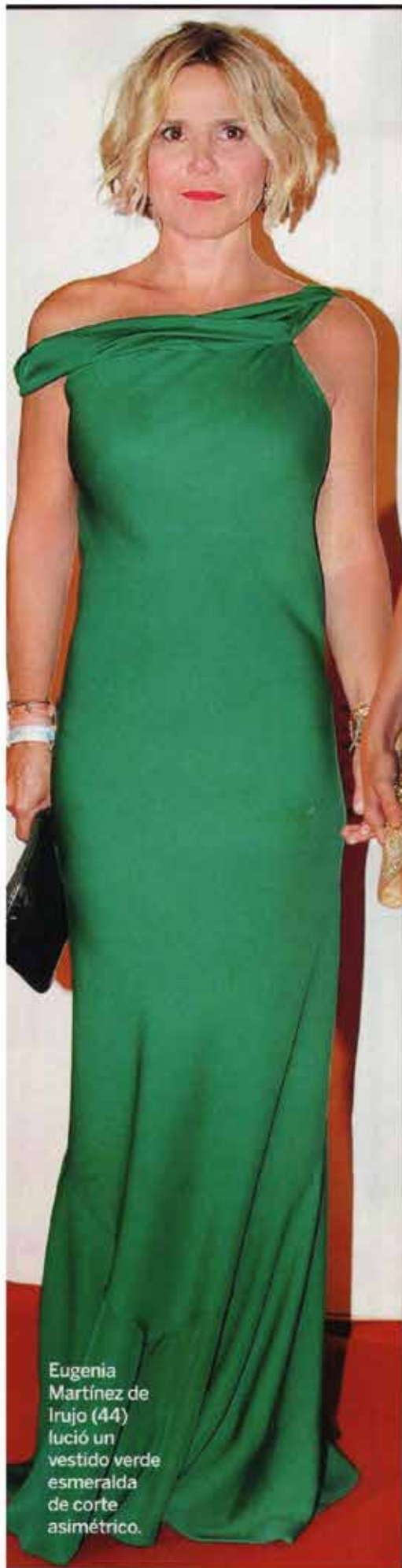
Eugenia Martínez de Irujo (44) lució un vestido verde esmeralda de corte asimétrico.