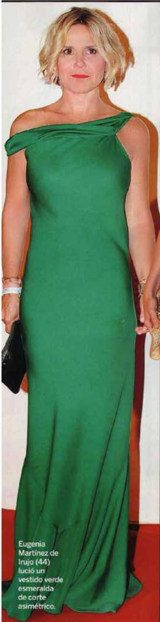
Eugenia Martínez de Irujo (44) lució un vestido verde esmeralda de corte asimétrico.