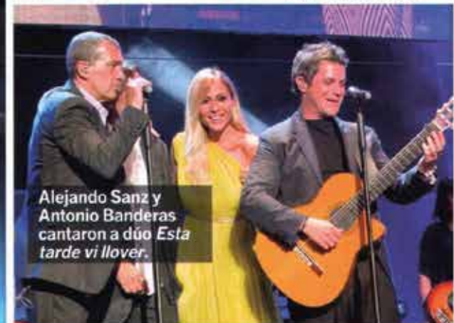
Alejandro Sanz y Antonio Banderas cantaron a dúo Esta tarde vi llover .