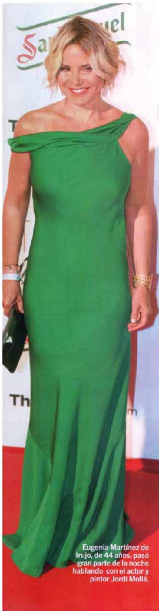
Eugenia Martínez de Irujo, de 44 años, pasó gran parte de la noche hablando con el actor y pintor Jordi Mollá.