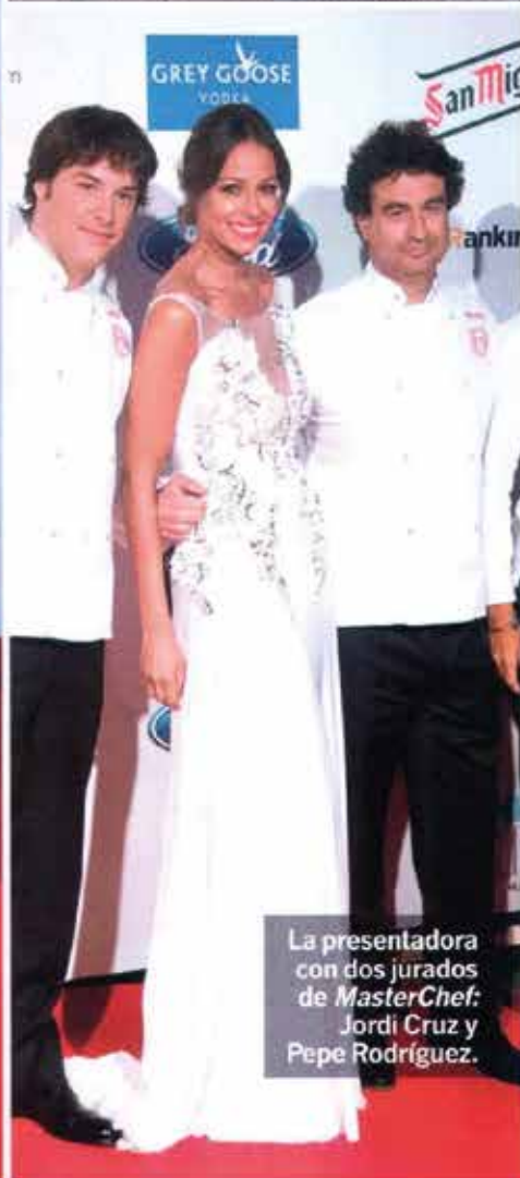
La presentadora con dos jurados de MasterChef : Jordi Cruz y Pepe Rodríguez.